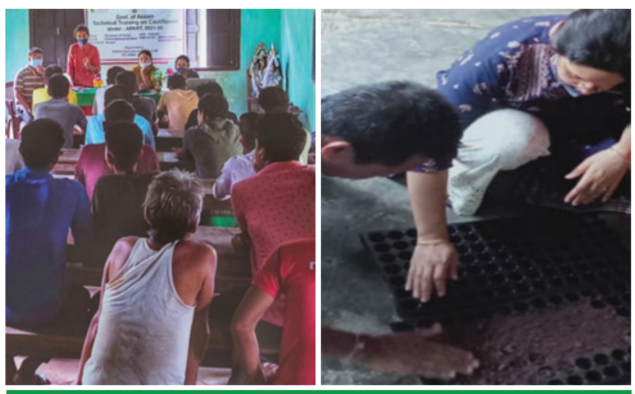
Technical Training on Cauliflower at Sonapur, Kamrup District by WorldVeg team