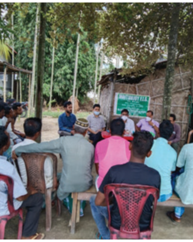
Interaction of WorldVeg team Centre team with FIGs, Vegetable farmers and traders