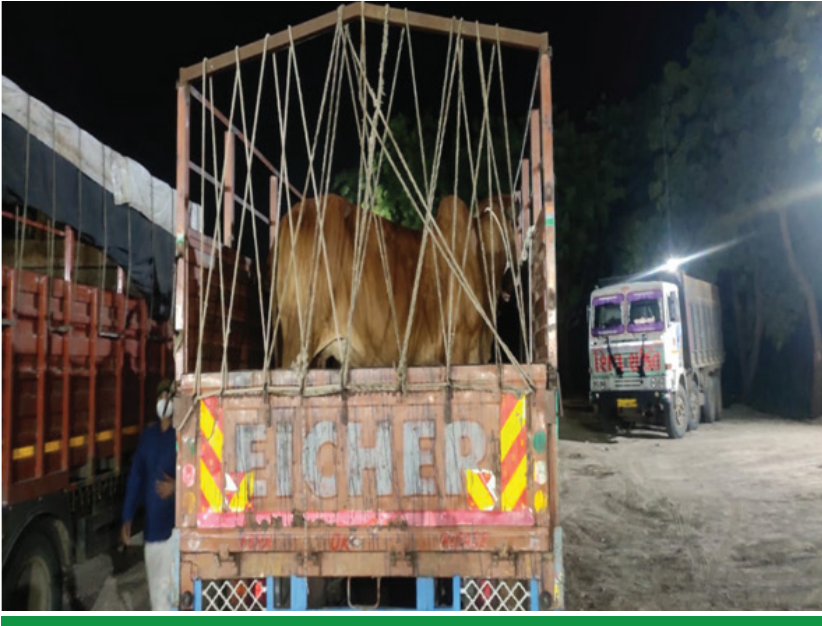
Loading in trucks from Bhavnagar to Ahmedabad railway station

The milk production data from 2007 to 2019 shows a gradual increase in milk availability from 824 to 945 million litres, still, the per capita milk availability in Assam is very low compared to other States. Going by the ICMR recommendation of 2588.00 million litres (2019-20), there is a shortfall in production of 1618.00 million litres with annual market availability of 1370.00 million litres.