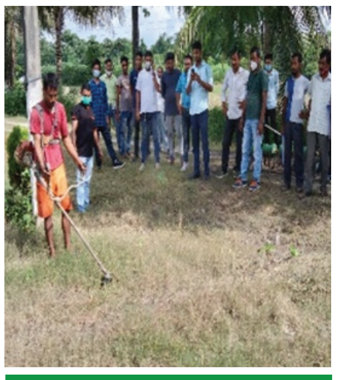
Demonstration of the use of power weeder

Mechanization plays a pivotal role in the modern agricultural scenario of the country to earn maximum profit in the stipulated time and resources availability. It is high time to adopt new technologies over conventional methods of cultivation to maximise productivity. The concept of Farmer Producer Company (FPC) is a prime focus in Assam under Assam Agribusiness & Rural Transformation Project (APART). The FPCs are strengthened through the support of Custom Hiring Centres (CHCs) for farm mechanization at various locations of the state. CHC is a place where all the farm equipment is made available on affordable rental mainly to the small and marginal farmers. Farmers can hire the machineries as and when required from the CHCs. For sustainability of these CHCs, ARIAS Society has started seven training facility centres at 7 KVKs for providing hands-on training in collaboration with AAU and IRRI on repair, maintenance, and operation of different farm machineries to the FPCs. The hands-on training will be given by experts from