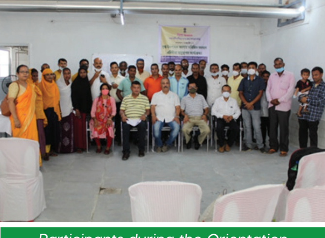
Participants during the Orientation Programme

assessment of DCSs was also organised for the members of DCSs of peri-urban areas of Kamrup district on 21st August 2021 at TMSS, Khanapara, under APART Dairy Development Department. A total of 30 participants from 18 different DCSs attended the programme.